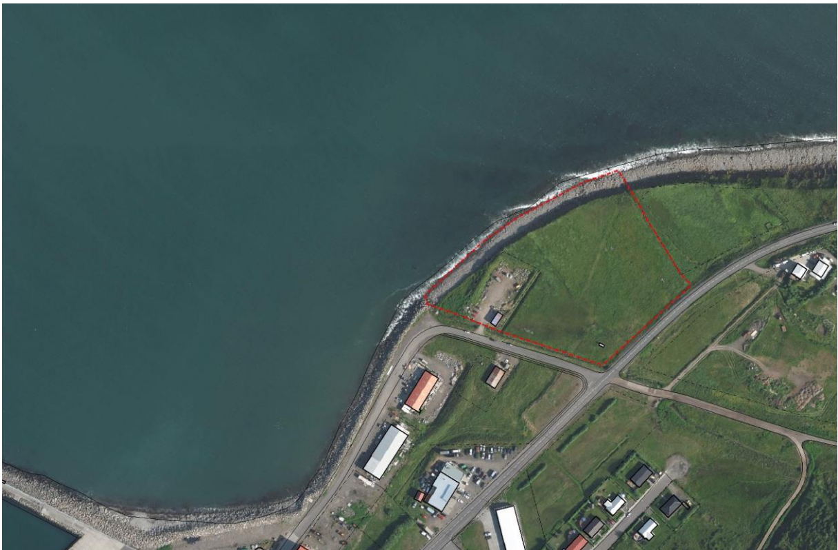
Mynd 1. Afmörkun skipulagssvæðisins

Skipulagssvæðið er um 19.000 fm að stærð og afmarkast af Námuveg til suðurs, Ólafsfjarðarveg til vesturs, og sjó til norðurs og austurs. Eitt hús stendur á skipulagssvæðinu, við Námuveg 11. Ekki er til deiliskipulag af svæðinu.